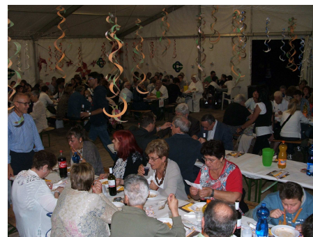
Non c'è che dire.... Proprio una gran bella compagnia!