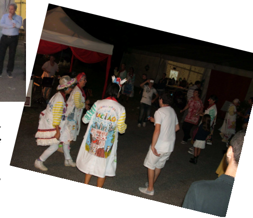
I clown del gruppo V.I.P. (Viviamo In Positivo) di Cittadella che, come nelle edizioni precedenti, e fatti divertire animando la festa