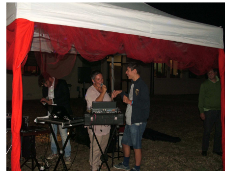
...e poi ancora musica, balli e tanta allegria!