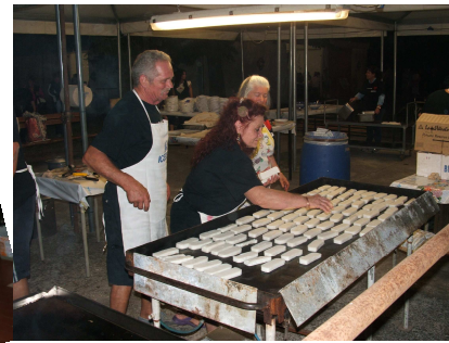
Evvai con la polenta!!!!