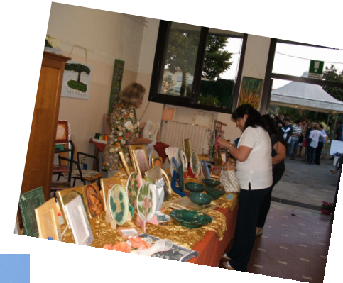
Mostra-mercato degli oggetti