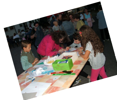
Il divertente laboratorio di girandole con i bimbi