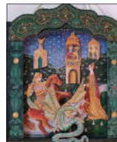
"S. Giorgio e il drago" realizzato con la tecnica del punzecchio